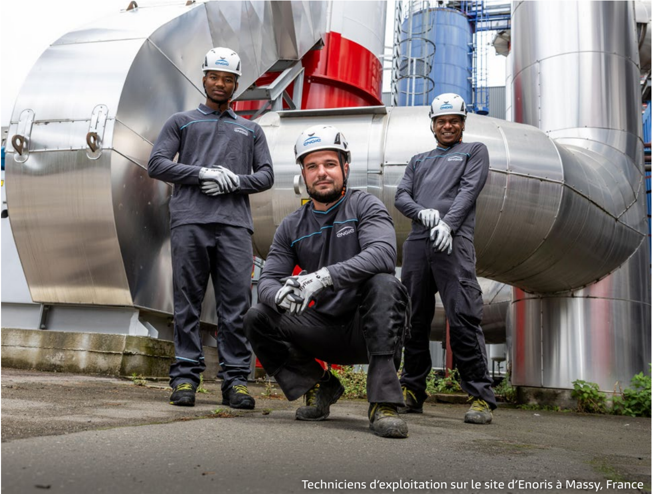
Techniciens d'exploitation sur le site d'Enoris à Massy, France

La force du Groupe repose sur sa maîtrise de toutes les technologies, lui permettant de concevoir, pour chaque territoire, les solutions les plus pertinentes et adaptées.