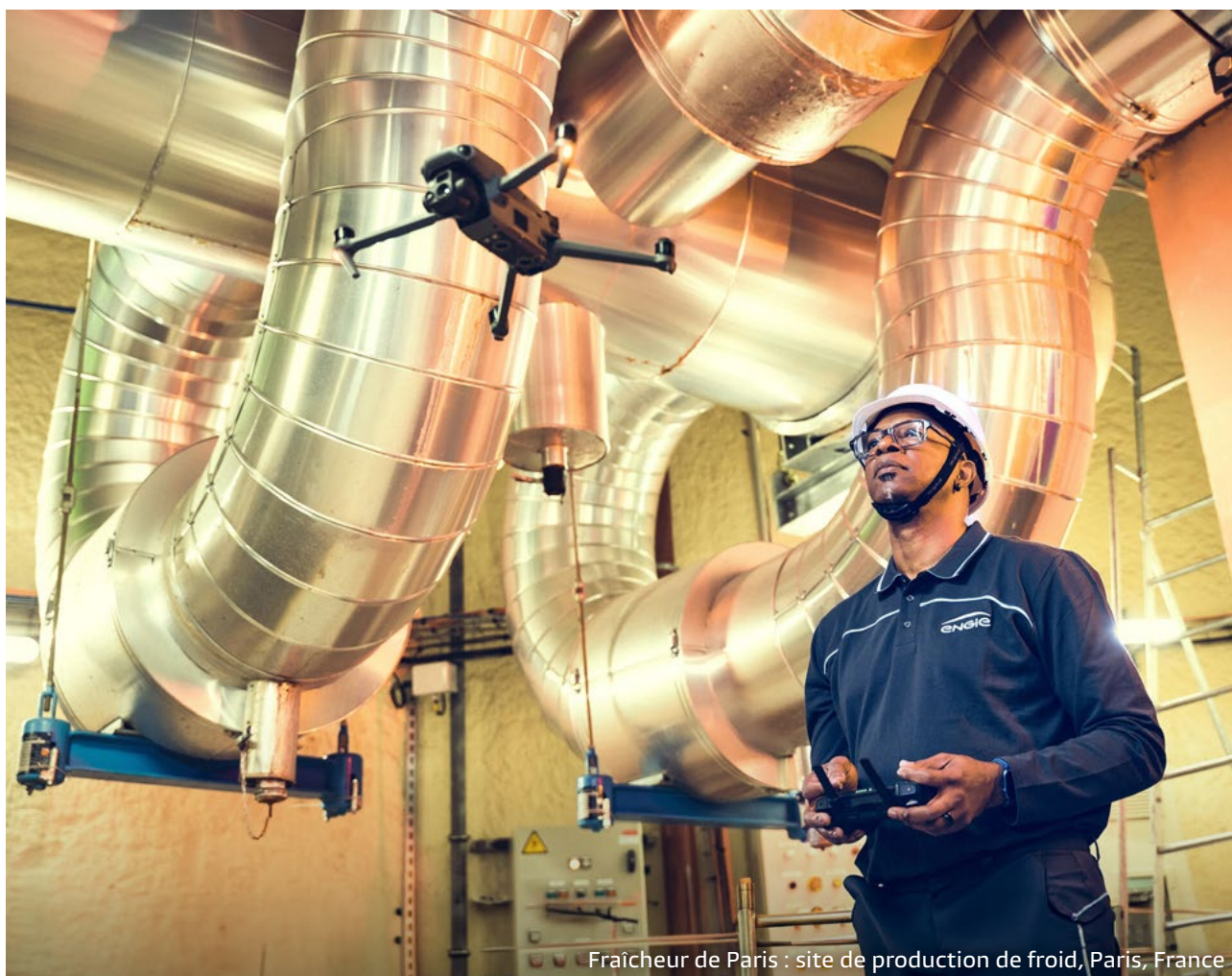
Fraîcheur de Paris : site de production de froid, Paris, France