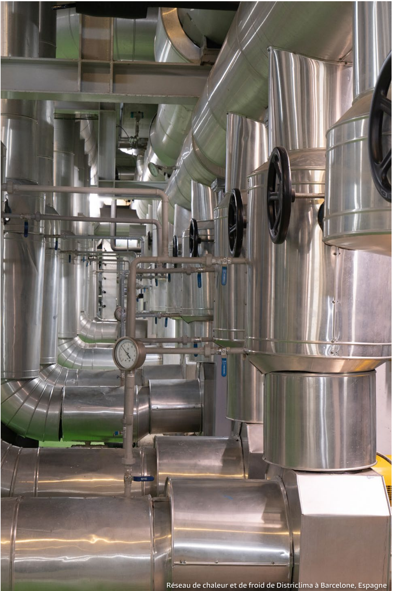
Réseau de chaleur et de froid de Districlima à Barcelone, Espagne